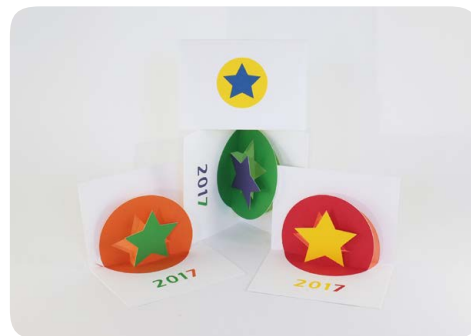
Cartes de vœux étoilées 2017 de MHT Pop up.