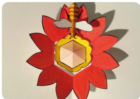
Fleur et abeille pour un livre pop-up d'anniversaire sur le thème de l'apiculture réalisé en 2015.