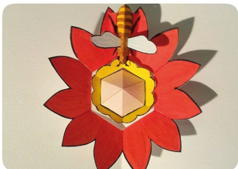
Fleur et abeille pour un livre pop-up d'anniversaire sur le thème de l'apiculture réalisé en 2015.

En 1999, j'effectue mon premier virage à 90° (toujours les angles...) et deviens comédienne. Formée l'école Le Samovar, je travaille pour plusieurs compagnies (Cie AMK, Cie Les Globe Trottoirs) sur des spectacles pour le jeune public. En 2005 je crée ma propre compagnie, Le repos du pied gauche, qui mêle les arts du clown, de la marionnette et de l'objet.