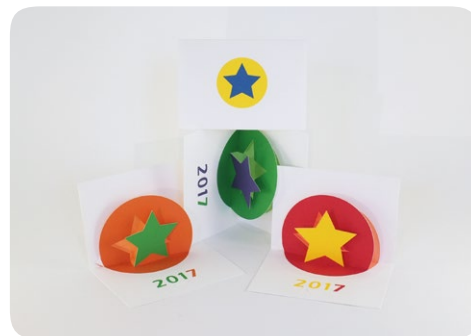
Cartes de vœux étoilées 2017 de MHT Pop up.