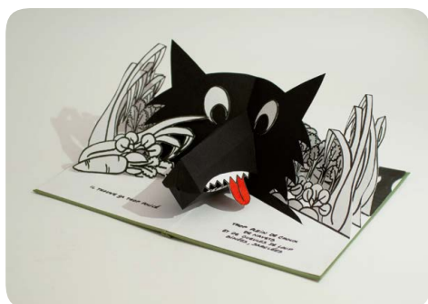
Projet de livre pop-up sur un texte de Bernard Sultan autour du jardin, du Loup et du Petit Chaperon Rouge, création 2015.